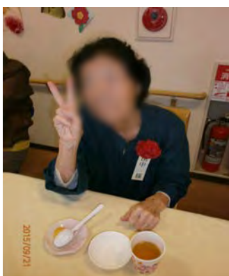
手作りゼリーのお味はどうでしたか？