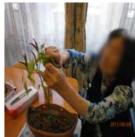
作った野菜を収穫 しました。