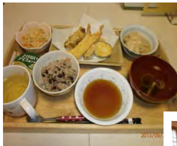
昼食はお赤飯と天ぷら

今年の敬老会にご家族様にも多数ご参加いただき、にぎやかに執り行うことができました！では会の様子をご紹介します♪