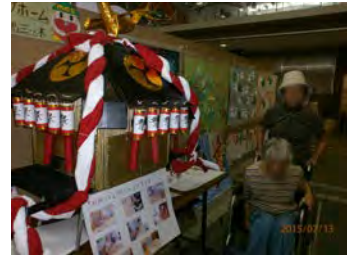
他ホームの御神輿