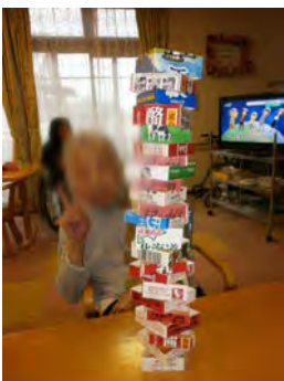
さすが〇〇さん 手先が器用ですね!