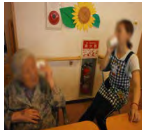
もしも~し! はいは~い!