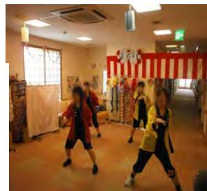
今年は職員もソーラン節を披露しました。皆さん盛り上げてくれました！