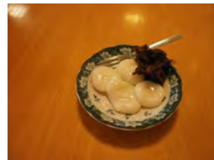
白玉あずきの完成です！