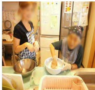
白玉粉をコネコネ！

7月は白玉あずき 8月はクレープを 作りました♪ みんなで協力して 美味しいおやつが 出来上がりました よ～！ 次回は何を作りま しょうね！？