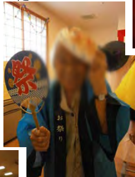
夏と言ったらスイカ割り！〇〇さんが見事に割りました♪